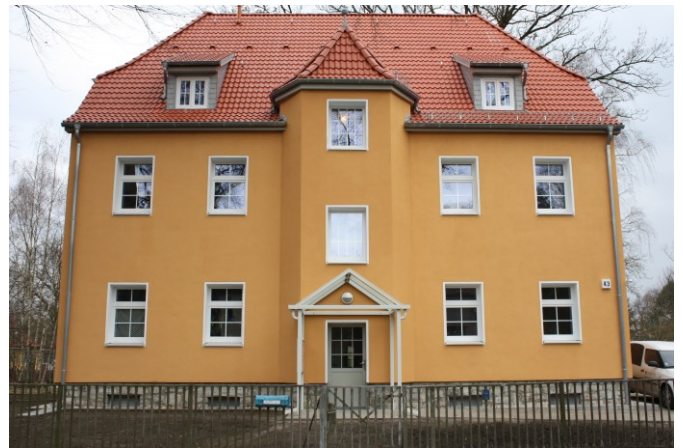
Komplexsanierung Rahnsdorfer Straße 43

verträglichen Mieten schaffen. Leider gibt es - bisher – keine Fördermittel vom Land für Sozialwohnungen.