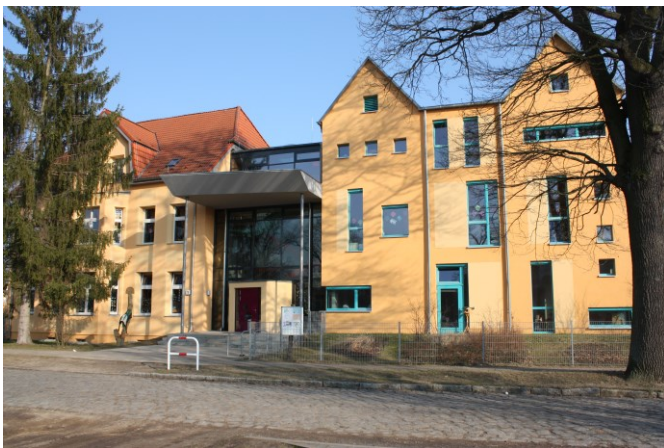
Kindertagesstätte Heupferdchen im Heuweg

Früher gar es die Lehmkute, heute gute Einkaufsmöglichkeiten und Wohnungen. 1989 wurde die ehemalige Gaststätte Grüne Aue abgerissen, heute steht dort das neue Rathaus. Die neue KultOurKate mit Bibliothek wurde gebaut. Die Kindertagesstätte am Heuweg wurde erweitert und saniert.