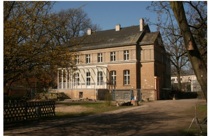
jetziges Hortgebäude, ehemals Kavaliershaus

Dorfstraße 40 eine Gesamtkapazität von insgesamt 210 barrierefreien Betreuungsplätzen umfassen.