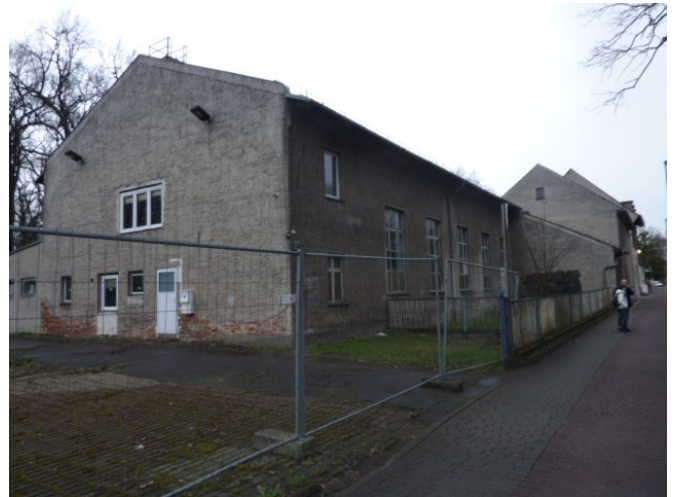
marodes Grundstück Dorfstraße 6, 7

Auf den Grundstücken Dorfauë 7 und 9 sollen alle maroden Gebäude abgerissen und es soll neu gebaut werden. Der Bauungsplan ist rechtskräftig. Gewünscht sind altengerechte Wohnungen und weitere Angebote für Seniorinnen und Senioren. Es gibt einen privaten Investor, aber bisher trotz intensiver Suche leider keinen Betreiber für eine Seniorenpflegeeinrichtung. Der Abriss soll 2015 erfolgen und anschließend soll neu gebaut werden.