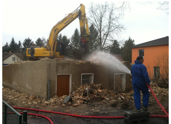
Abrissarbeiten Brandenburgische Straße 66 „Graue Laus“

Die Baukosten liegen bei 640.000 €. Die Nettokaltmiete soll 6 €/qm betragen.